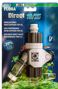
JBL ProFlora Direct Эффективный непосредственный диффузор для CO2