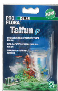
JBL ProFlora Taifun P Миниатюрный CO2-диффузор для пресноводных аквариумов