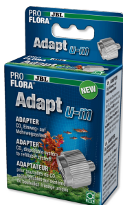
JBL ProFlora Adapt u-m Переходник с одноразовых на многоразовые баллоны