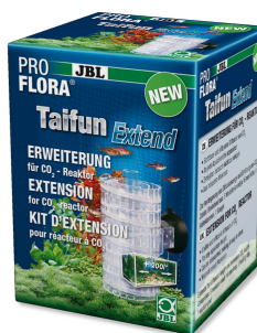
JBL PROFLORA Taifun Extend Модуль расширения диффузионного CO2- реактора