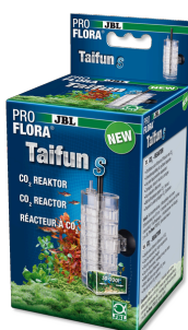
JBL PROFLORA Taifun S Расширяемый CO2-диффузор для миниатюрных аквариумов