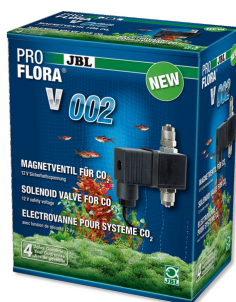
JBL PROFLORA v002 Бесшумный электромагнитный клапан