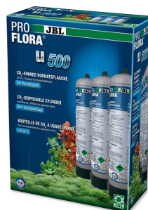
JBL PROFLORA 3 x u500 Сменный одноразовый CO2 баллон