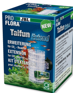
JBL PROFLORA Taifun Extend Модуль расширения диффузионного CO2-реактора