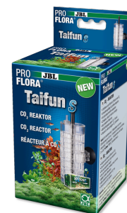
JBL PROFLORA Taifun S Расширяемый CO2-диффузор для миниатюрных аквариумов