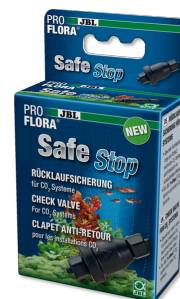
JBL PROFLORA SafeStop Защита от обратного тока воды для CO2-систем