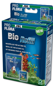
JBL ProFlora BioRefill Компоненты для Bio-CO2 системы