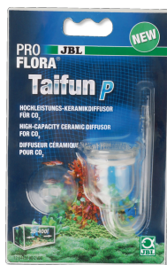
JBL ProFlora Taifun P Миниатюрный CO2-диффузор для пресноводных аквариумов