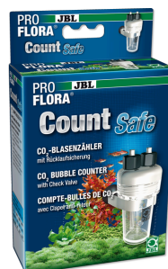
JBL PROFLORA CO2 Count Safe Счётчик пузырьков с обратным клапаном