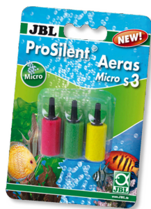
JBL ProSilent Aeras Micro S3 Набор распылителей для мелких пузырьков в аквариуме