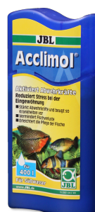
JBL Acclimol Кондиционер для акклиматизации