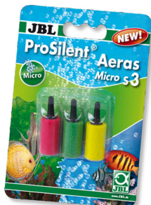
JBL ProSilent Aeras Micro S3

Круглый распылитель для мелких пузырьков в аквариуме