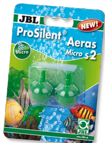
JBL ProSilent Aeras Micro S2

Круглый распылитель для мелких пузырьков в аквариуме