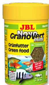
JBL NovoGranoVert mini

Основной корм в гранулах для растительноядных рыб