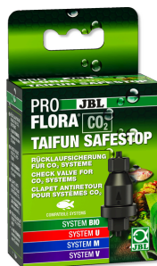
JBL PROFLORA CO2 TAIFUN SAFESTOP Wasserrücklaufsicherung für CO2-Anlagen