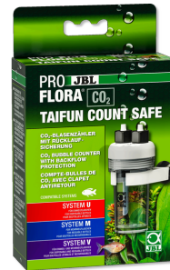
JBL PROFLORA CO2 TAIFUN COUNT SAFE Compte-bulles de CO2 avec clapet antiretour intégré