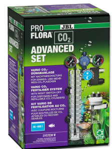
JBL PROFLORA CO2 ADVANCED SET V Kit CO2 + manomètres et électrovanne, SANS BOUTEILLE