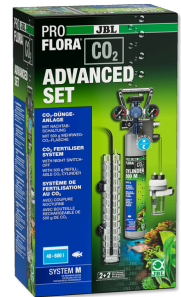
JBL PROFLORA CO2 ADVANCED SET M CO2-Pflanzendüngeranlage-Komplettset + Nachtschaltung