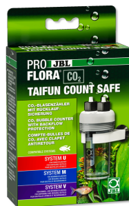
JBL PROFLORA CO2 TAIFUN COUNT SAFE Compte-bulles de CO2 avec clapet antiretour intégré