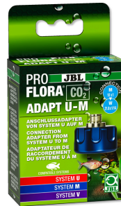
JBL PROFLORA CO2 ADAPT U - M CO2 Umrüstungs-Adapter von Einweg- auf Mehrwegflaschen