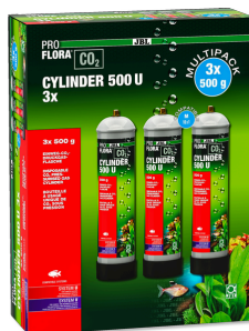
JBL PROFLORA CO2 CYLINDER 500 U 3x 500 g CO2-Einweg-Vorratsflasche (3er Vorteils-Pack)