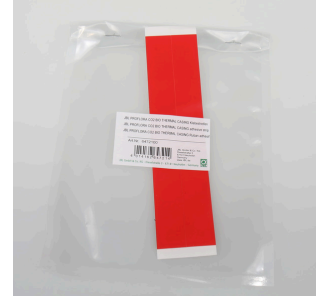
JBL PF CO2 BIO THERMAL CASING Ruban adhésif