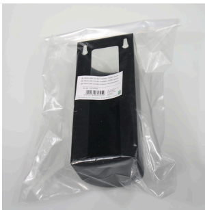
JBL PF CO2 BIOTHERMAL CASING