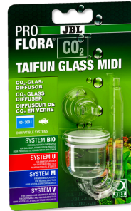
JBL PROFLORA CO2 TAIFUN GLASS Diffuseur de CO2 en verre pour aquarium de 40 à 300 l