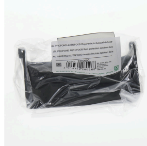
JBL PP AUTOFOOD Regenschutz Auswurf