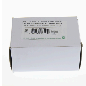
JBL PP AUTOFOOD Netzteil