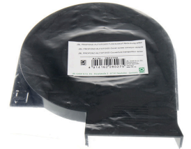
JBL PP AUTOFOOD Futterauswurf Abdeck. u.