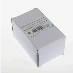
JBL PP AUTOFOOD Temperatur Sensor