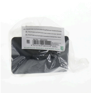
JBL PP AUTOFOOD Eingriffsch. Fördersch. n.