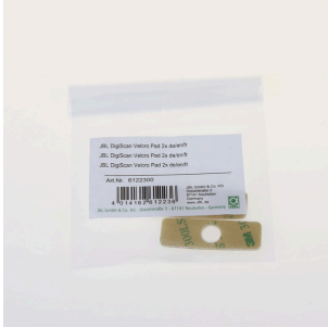
JBL DigiScan Velcro Pad 2x