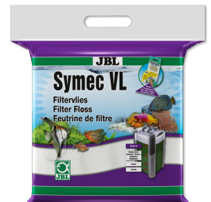
JBL Symec VL Microfibre filtrante contre toutes turbidités de l'eau