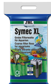
JBL Symec XL Ouate filtrante grossière contre la turbidité de l'eau