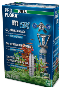
JBL PROFLORA m501 Système complet de fertilisation au CO2 des plantes aquatiques