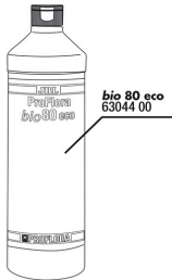
JBL Bio80 eco Flaçon à réaction