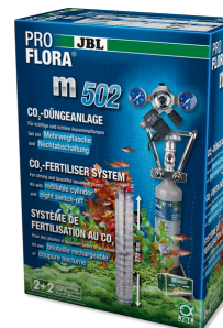
JBL PROFLORA m502 Fertilisation au CO2 des plantes aquatiques avec coupure nocturne