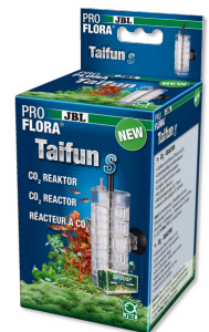
JBL PROFLORA Taifun S Diffuseur de CO2 extensible pour petit aquarium