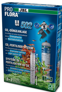
JBL PROFLORA u502 Système de fertilisation avec coupure nocturne