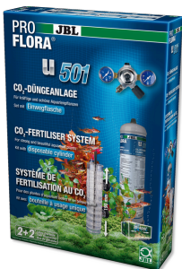
JBL PROFLORA u501 Système de fertilisation des plantes en kit complet