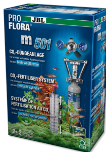
JBL PROFLORA m501 Système complet de fertilisation au CO2 des plantes aquatiques