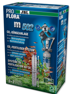
JBL PROFLORA m502 Fertilisation au CO2 des plantes aquatiques avec coupure nocturne