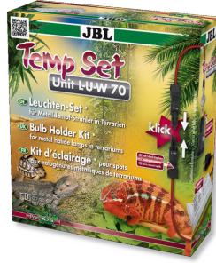
JBL TempSet Unit L-U-W Kit d'installation pour spot à décharge (LUW et HQI)