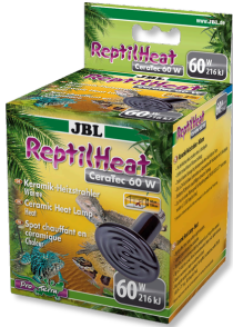
JBL ReptilHeat Spot chauffant en céramique