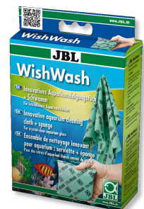
JBL WishWash Reinigungstuch und Schwamm