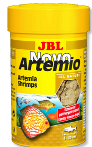
JBL NovoArtemio Artemia-Ergänzungsfutter für alle Aquarienfische