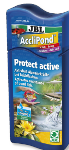
JBL AccliPond Wasseraufbereiter für Teich