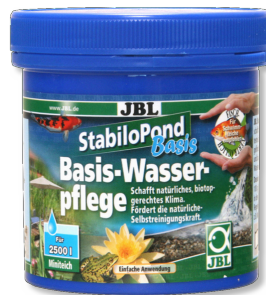
JBL StabiloPond Basis Produit d'entretien de base pour bassins