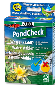
JBL PondCheck Test rapide pour la détermination du pH et du KH