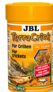
JBL TerraCrick Aliment complet pour insectes alimentaires