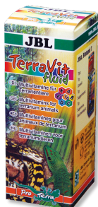
JBL TerraVit fluid Vitamines et oligoéléments pour animaux de terrarium