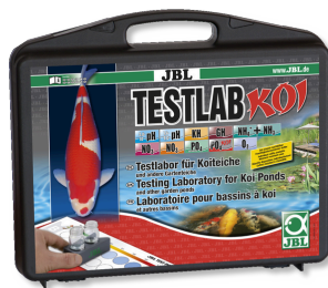
JBL Testlab Koi Coffret de tests professionnel pour bassins