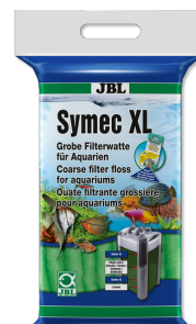
JBL Symec XL Ouate filtrante grossière contre la turbidité de l'eau