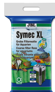
JBL Symec XL Grobe Aquarien-Filterwatte gegen alle Wassertrübungen