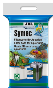
JBL Symec Filterwatte Filterwatte gegen alle Wassertrübungen