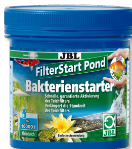
JBL FilterStart Pond Activateur de bactéries pour filtre de bassin