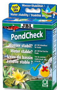
JBL PondCheck Schnelltest zur Bestimmung von pH- und KH-Wert