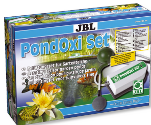
JBL PondOxi-Set Belüftungs-Set mit Luftpumpe für Gartenteich