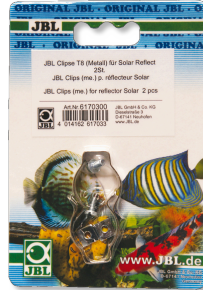
JBL Clipse T5/T8 Metall Metallhalterung für Leuchtstoffröhren