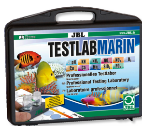
JBL Testlab Marin Coffret professionnel d'analyse de l'eau de mer