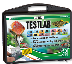
JBL Testlab Coffret de 13 tests pour analyse de l'eau douce