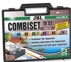
JBL Kit Combiset Test Plus Fe Coffret avec les principaux tests d'eau + test fer