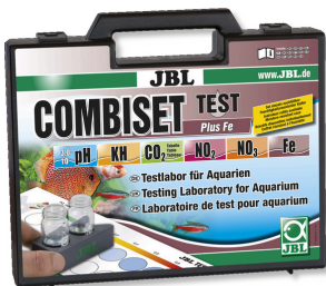
JBL Test Combi Set Plus Fe Testkoffer mit den wichtigsten Wassertests + Eisentest