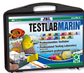
JBL Testlab Marin Coffret professionnel d'analyse de l'eau de mer