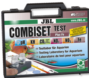
JBL Kit CombiSet Test Plus Fe Coffret avec les principaux tests d'eau + test fer