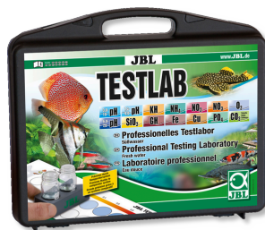
JBL Testlab Coffret de 13 tests pour analyse de l'eau douce