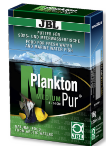
JBL PlanktonPur MEDIUM Friandises pour grands poissons d'aquarium