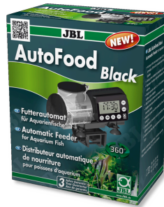
JBL AutoFood BLACK Schwarzer Futtermat für Aquarienfische