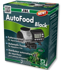
JBL AutoFood BLACK Schwarzer Futterautomat für Aquarienfische