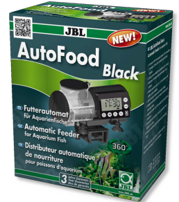
JBL AutoFood BLACK Schwarzer Futterautomat für Aquarienfische