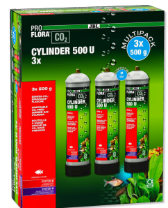
JBL PROFLORA CO2 CYLINDER 500 U 3x 500 g CO2-Einweg-Vorratsflasche (3er Vorteils-Pack)