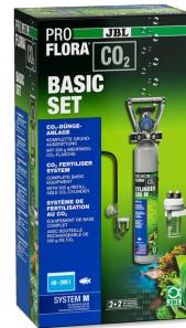
JBL PROFLORA CO2 BASIC SET M CO2-Düngeranlage Basis-Komplettset für Aquariumpflanzen