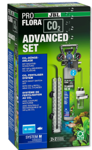
JBL PROFLORA CO2 ADVANCED SET M CO2-Pflanzendüngeranlage-Komplettset + Nachtabschaltung