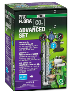
JBL PROFLORA CO2 ADVANCED SET V CO2-Anlage OHNE FLASCHE mit Manometern & Magnetventil