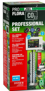
JBL PROFLORA CO2 PROFESSIONAL SET U CO2-Pflanzendüngeranlage-Komplettset + CO2-pH-Steuerung