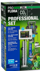
JBL PROFLORA CO2 PROFESSIONAL SET M CO2-Pflanzendüngeranlage mit CO2 Steuerungscomputer