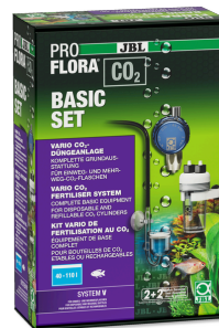
JBL PROFLORA CO2 BASIC SET V CO2-Düngeranlage OHNE FLASCHE für Aquariumpflanzen