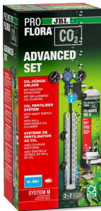
JBL PROFLORA CO2 ADVANCED SET U CO2-Pflanzendüngeranlage-Komplettset + Nachtabschaltung