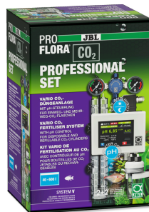
JBL PROFLORA CO2 PROFESSIONAL SET V CO2-Pflanzendüngeranlage mit CO2 Steuerung/OHNE FLASCHE