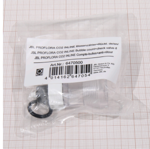
JBL PF CO2 INLINE Blaszähler+Rücklauf.

Austauschmembran für CO2 TAIFUN INLINE Diffusor