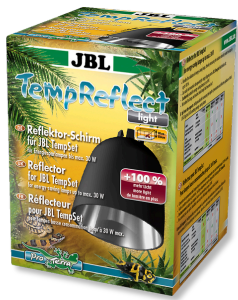
JBL TempReflect light Reflektor-Schirm für Energiesparlampen