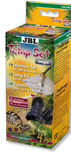
JBL TempSet angle Installationsset für Terrarien- Strahler