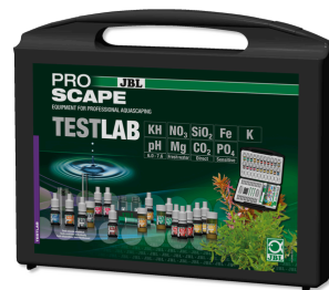
JBL PROAQUATEST LAB PROSCAPE Testkoffer zur Wasseranalyse in Pflanzenaquarien