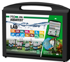
JBL PROAQUATEST LAB Testkoffer mit 13 Wassertests zur Süßwasser-Analyse