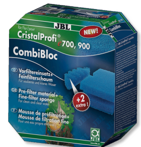
JBL CombiBloc CristalProfi e Vorfiltereinsätze und Schaum für CristalProfi e