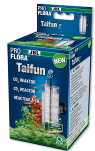
JBL PROFLORA Taifun S Erweiterbarer CO2-Diffusor für kleine Aquarien