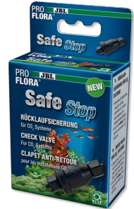
JBL PROFLORA SafeStop Wasserrücklaufsicherung für CO2-Systeme