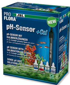
JBL PROFLORA pH-Sensor+Cal pH-Elektrode mit BNC-Anschluss