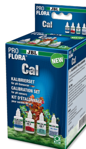
JBL PROFLORA Cal Komplettsatz zur Kalibrierung