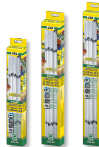
JBL SOLAR Reflect T5/ T8 - 895-1500 mm Reflektorblech für Solar- Leuchtstoffröhre