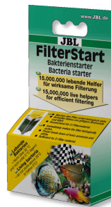
JBL FilterStart Bakterien zur Aktivierung von Filtern