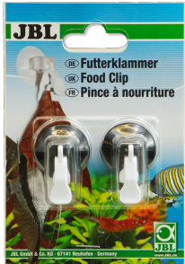
JBL Futterklammer Universalklammer für Futter und Salatblätter