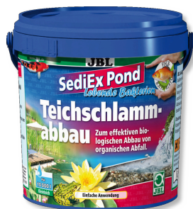
JBL SediEx Pond Bakterien und Aktivsauerstoff zum Abbau von Schlamm