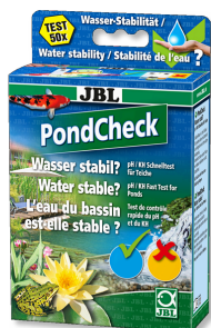
JBL PondCheck Schnelltest zur Bestimmung von pH- und KH-Wert