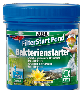
JBL FilterStart Pond Bakterienstarter für Teichfilter