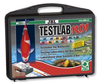
JBL Testlab Koi Professioneller Testkoffer für Koi- und Gartenteich